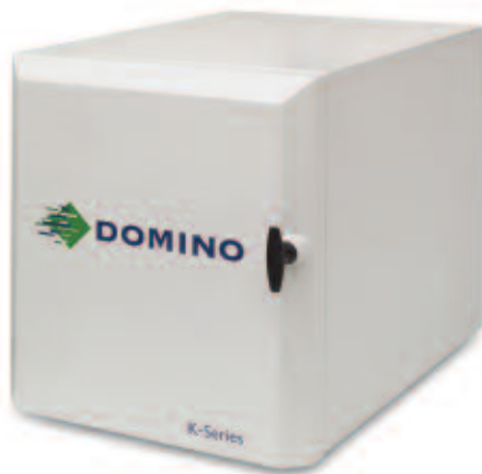
Basisstation mit innenliegendem Tintensystem

Jeder K200 Druckkopf wird von einer kompakten Basisstation in Gestellbauweise gesteuert (bis zu acht Basisstationen pro System möglich). Die Elektronikinheit kann entweder im Controller-Gehäuse (wie nebenstehend gezeigt) untergebracht, als separates, freistehendes System (wie unten gezeigt) in Form eines oder zwei übereinander angeordneten Gehäuse aufgestellt oder direkt in eine Produktionsstraße integriert werden.