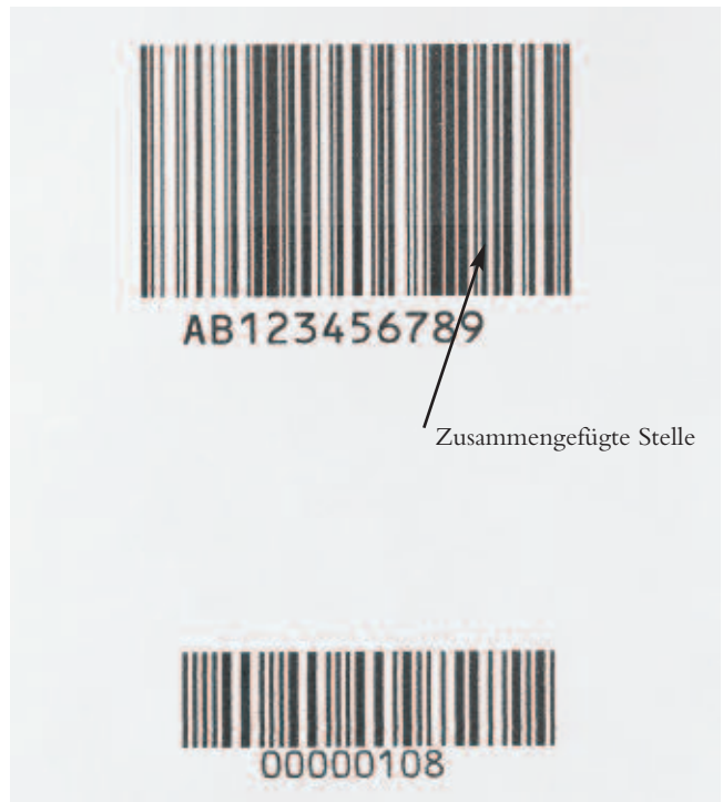
122 mm Druckbreite, Auflösung 421 x 316 dpi. Einschließlich elektronische Bildzusammenfügung mit zwei Druckköpfen

Mit einer rautenförmigen Druckkopf-Konfiguration (Winklereinstellung 71,6 Grad) können beim K200 zwei oder mehr Druckköpfe nebeneinander auf derselben Ebene angeordnet werden. Durch Synchronisierung der Köpfe lassen sich zusammengefügte Bilder mit einer Gesamtbildbreite von 122 mm bei zwei Druckköpfen bzw. 183 mm bei drei Druckköpfen usw. erzeugen. Bei Lösungen mit mehreren Druckköpfen erleichtert die „Electronic Stitching“ Funktion des Editor GT die Druckereinrichtung indem jede Druckposition schnell und präzise konfiguriert wird.