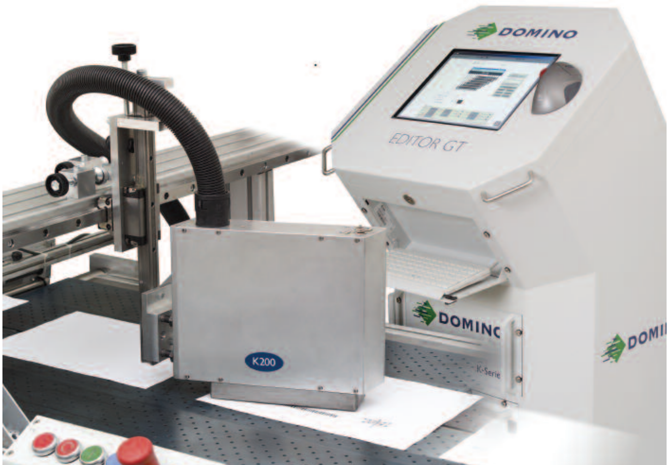
K200 Drucker mit dem intuitiven, auf Windows XP basierenden Editor GT Controller für Datenhandling und Systemeinrichtung. Mit Gehäuse (wie abgebildet) oder als Desktop-Variante verfügbar.

Der K200 bietet eine Lösung für digitalen Inline-Tintenstrahldruck mit der sie Ihre im Offset- oder Flexoverfahren gedruckten Produkte teilweise personalisieren oder mit Nummerierungen, Grafiken, Barcodes sowie Adressen vervollständigen können. Durch Verwendung der innovativen Stitching-Software wird eine nahtlose Bildkomposition mit mehreren Druckköpfen erreicht. Dadurch wird das Drucken ganzer Seiten oder die Personalisierung von Papierbahnen möglich. Typische Anwendungen sind z.B. der Inline-Druck auf schmalbahnigen Druckmaschinen, Plastikkarten und Direkt-Mailings.